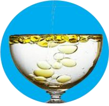
ماء سقط فيه زيت